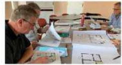
Des membres du comité de pilotage (membres de l'association, habitants et élus) avec le plan de la maison.

Une maison pour seniors ouvrira en 2024, créée par l'association Habit'Age.